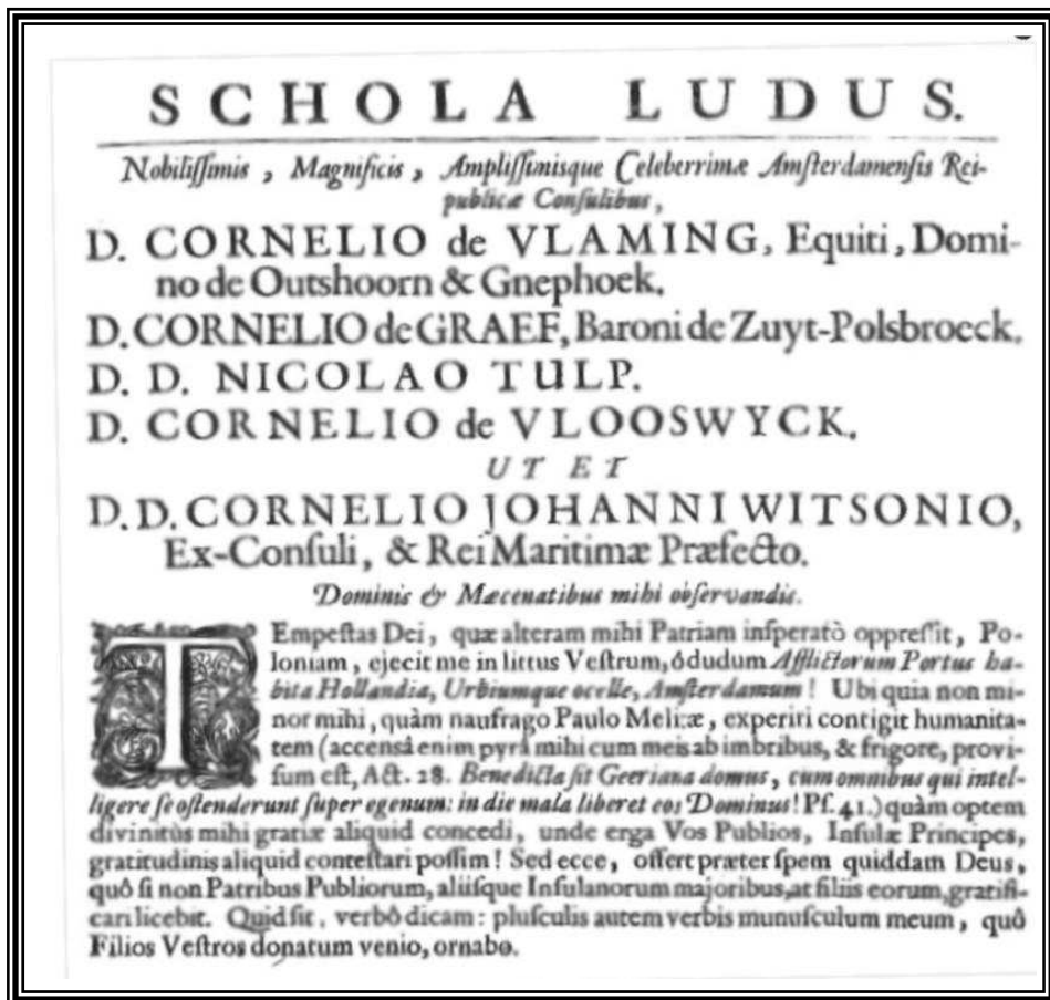
Titelblad De school als spel (1657)

Iedereen die belangstelling heeft voor de activiteiten van de Comenius Stichting kan dit kenbaar maken door zich op te geven als donateur. De stichting verkrijgt haar gelden uit bijdragen van fondsen, bedrijven, stichtingen alsmede uit donaties van particulieren. Aanmelding als donateur kan geschieden d.m.v. het overmaken van minimaal € 16,50-- per jaar. Donateurs ontvangen automatisch Comenius Contact en één gratis toegangskaart voor de Comeniusdag. Donateurs die € 45,-, of meer storten ontvangen tenminste twee toegangskaarten voor de Comeniusdag. De Comenius Stichting is vrijgesteld van schenkings- en successierechten in de zin van artikel 32 ten eerste en artikel 33 ten eerste van de successiewet 1956.