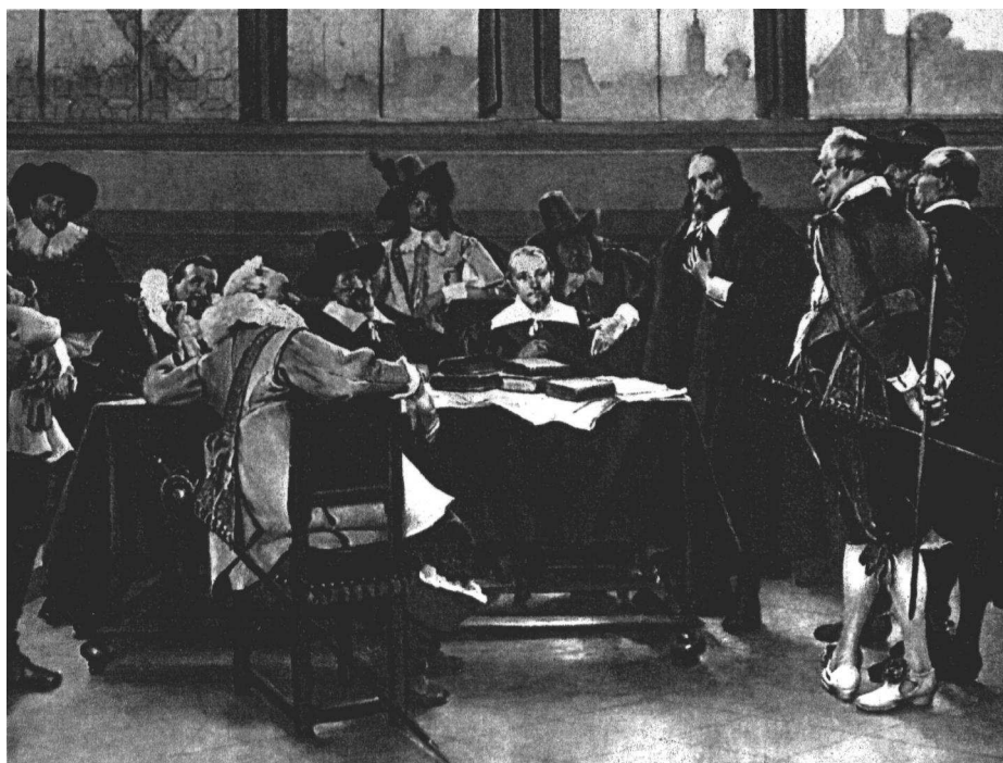
Ontvangst Comenius stadhuis Amsterdam Staatsmuseum Praag Václav Brožík 1898

De Schola Ludus is in 1657 tweemaal gedrukt. Eenmaal in een afzonderlijke uitgave en eenmaal als onderdeel van de Opera Didactica Omnia . Het geschrift is voorzien van een opdracht aan de Amsterdamse burgemeesters (zie het titelblad op de volgende pagina). Bovendien moet hier nog vermeld worden, dat de ontvangst van Comenius in het Amsterdamse stadhuis ook is vereeuwigd in een schilderij (zie foto).