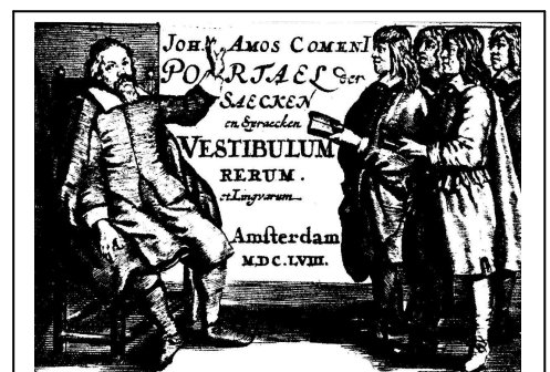
Comenius en zijn leerlingen.

Het wordt dan mogelijk om aan de hand van dit geïllustreerde leerboek kennis te maken met de wijze waarop Comenius de leerlingen zowel in beeld- als in schrijftaal vertrouwd wilde maken met hun leefwereld. Jan Luyken ( Het menselijk bedrijf ) en Jan Ligthart ( Het volle leven ) namen later de fakkel van Comenius over. Ongetwijfeld zal Jan Amos vanaf zijn zetel hierboven verheugd vaststellen dat het Portael binnenkort voor alle Nederlanders online beschikbaar is.